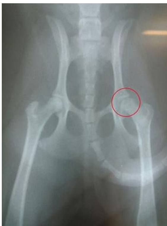
FIGURA 1: Imagem fotográfica de exame radiográfico ventro-dorsal da articulação coxo-femoral de um cão da raça Spitz Alemão apresentando necrose asséptica unilateral da cabeça de fêmur. Observam-se focos de osteólise na cabeça do fêmur (círculo).

O animal foi encaminhado para radiografia, onde foi utilizada projeção ventro-dorsal da região pélvica. No exame radiográfico foi visualizado uma diminuição da opacidade óssea, com pequenas áreas de lise da cabeça e colo femorais, perda do contorno arredondado característico da cabeça do fêmur, leve aumento do espaço articular entre acetábulo e cabeça do fêmur (FIGURA 1). Baseado no histórico, no exame físico e radiográfico realizado, diagnosticou-se a afecção apresentada no membro pélvico direito do animal como Necrose Asséptica da Cabeça do Fêmur.