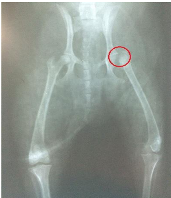
FIGURA 4: Imagem fotográfica de exame radiográfico ventro-dorsal da articulação coxo-femoral de um cão da raça Spitz Alemão após colocephalotomia.

procedimento cirúrgico, onde foi possível verificar que a retirada do colo e cabeça femoral ocorreu com sucesso (FIGURA 4).