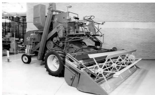
Fig.2. Colheitadeira SLC modelo 65-A

A máquina colhedora chegou para substituir os cortadores de cana, sendo assim de porte pequeno podendo substituir 50 pessoas e a de porte grande fazendo o trabalho de 100 a 150 trabalhadores. É um equipamento agrícola destinado a colheita de lavouras, não só cana de açúcar, mas também algodão e principalmente grãos. A modernização das lavouras com grande plantio comerciais, contribuíram para que a colheita feita manualmente fosse feita por tais máquinas, dando início a essa evolução. Há 40 anos foi produzida a primeira colheitadeira automotriz no Brasil. O lançamento da colheitadeira SLC modelo 65-A (Fig. 2.), fabricada em Horizontina, foi feito no dia 5 de novembro de 1965. As colheitadeiras também eram conhecidas como ceifeira-debulhadora, esse nome era muito utilizado em Portugal, hoje as colhedoras são fundamentais no trabalho agrícola e diversas empresas estão sempre visando expansão nessa área.